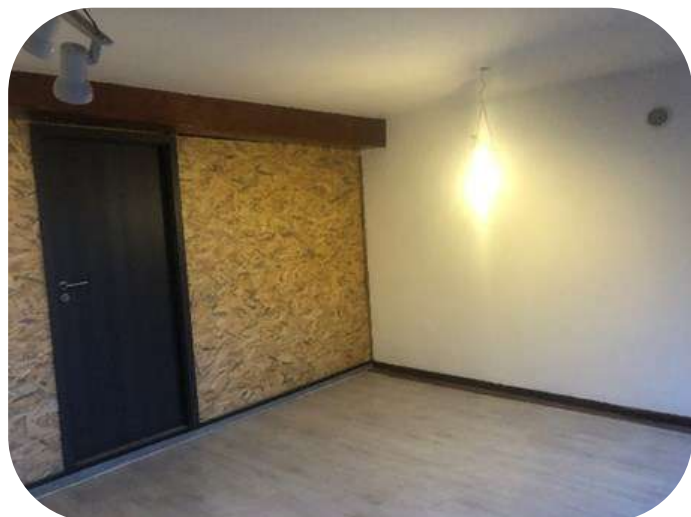
Local d'extension avant sa rénovation et après