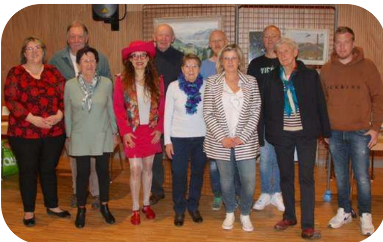
Les artistes locaux

La salle festive a servi de cadre le dimanche 13 mars 2022 pour une exposition originale. Elle a mis en exergue les talents ou passions cachés d'une dizaine d'habitants d'Ernolsheim qui ont présenté leurs créations.