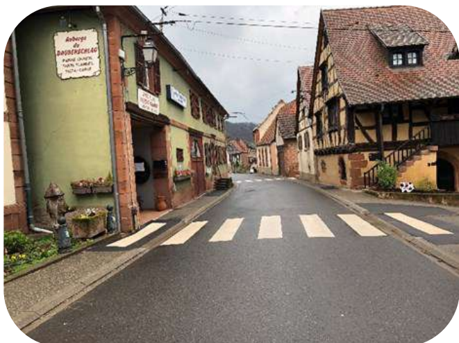
Mise en place de la signalétique