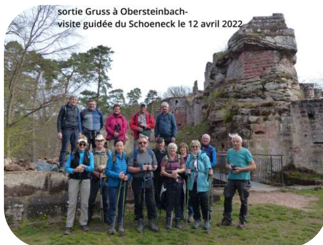
sortie Gruss à Obersteinbach- visite guidée du Schoeneck le 12 avril 2022