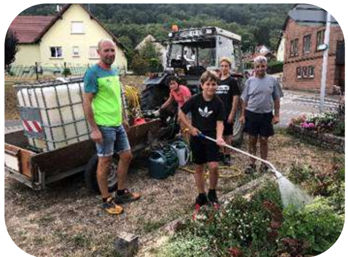
Les équipes de plantation et d'arrosage