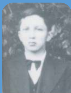
Extrait de la photo de confirmation en 1940.