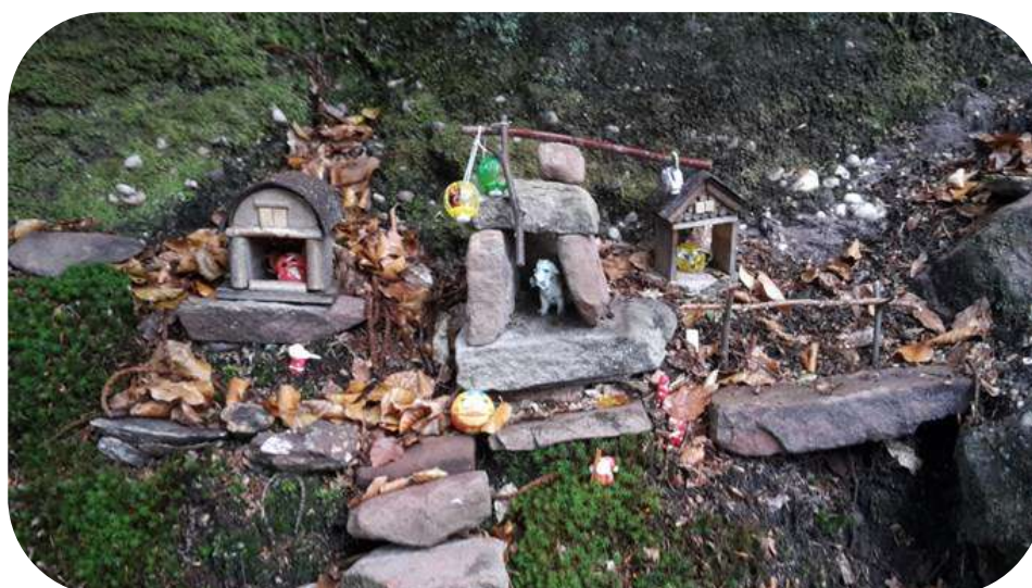
Le village miniature est implanté en bordure du chemin-neuf-du-bas.

En rencontrant des groupes de personnes recherchant la fraîcheur et qui allaient ou venaient du site du Warthenberg guidé en ce jour, la découverte de scènes en miniatures a agréablement surpris enfants et adultes.