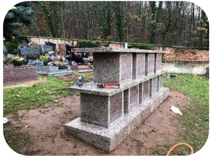
Extension du columbarium