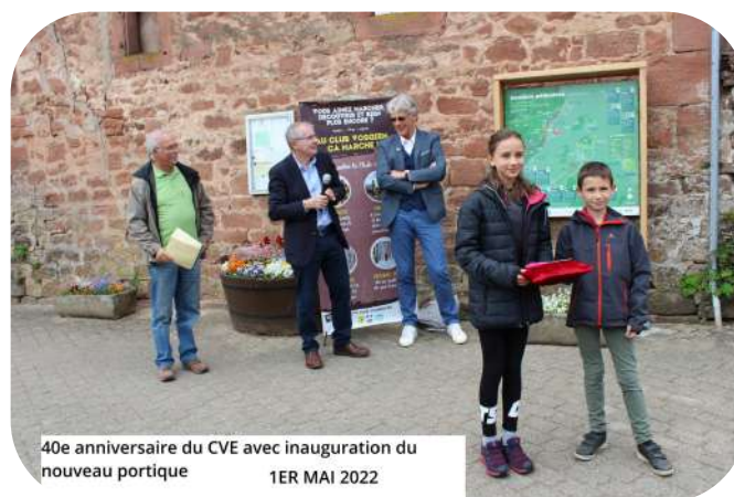
40e anniversaire du CVE avec inauguration du nouveau portique 1ER MAI 2022