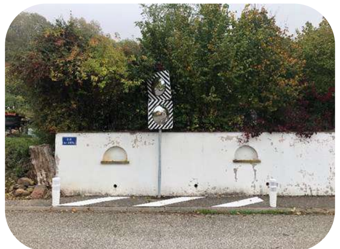
Mise en place de miroirs