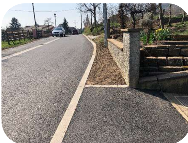
Deuxième tranche Rue des Vergers