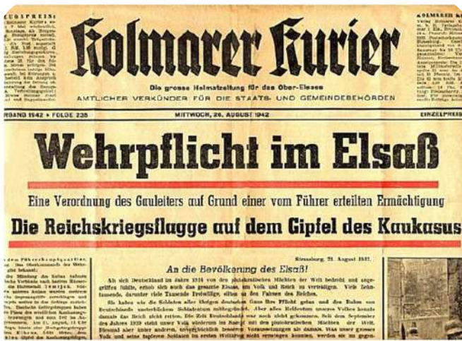
Le "Kolmarer Kurier" du mercredi 26 août 1942 qui publie l'ordonnance du Gauleiter Robert Wagner

Triste anniversaire du décret du gauleiter Wagner