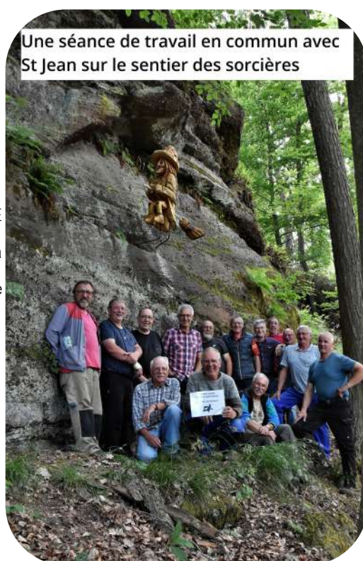
Une séance de travail en commun avec St Jean sur le sentier des sorcières