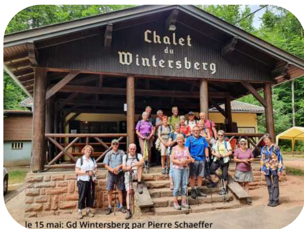
le 15 mai: Gd Wintersberg par Pierre Schaeffer

Vous avez des enfants de 7 à 14 ans, alors n'hésitez pas à les inscrire au CVE pour des activités en rapport avec la nature (programme affiché en bas de la maison de la culture). Mais aussi de participer aux sorties bi-mensuelles de marche en consultant le site du club sur : http://cvernolsheim.fr