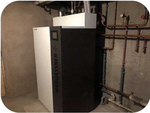
Remplacement de la chaudière du presbytère