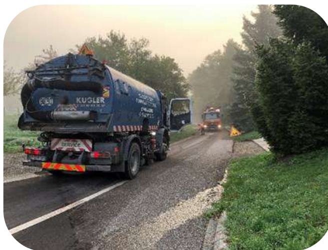
Rénovation de rues : Zinsel, Steinbourg, Stade