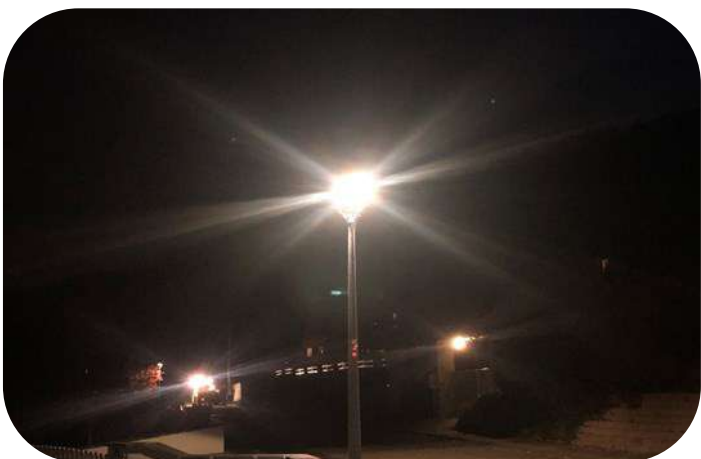
Remplacement des ampoules par des leds