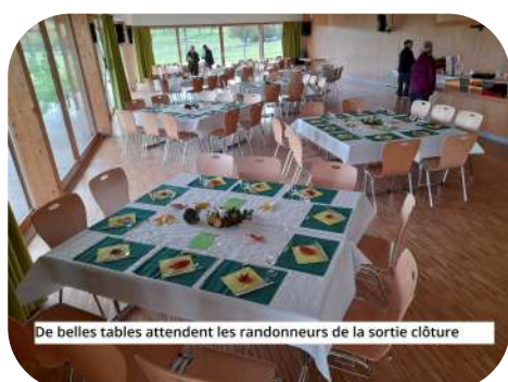
De belles tables attendent les randonneurs de la sortie clôture

La devise du club vosgien : un jour de sentier= une semaine de santé