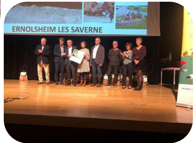
Remise officielle du prix 2ème fleur à Erstein le 15 mars 2022